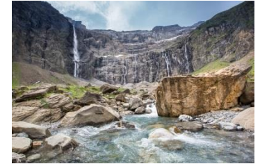
▲ Cirque de Gavarnie ▼ Vers le plateau de Pailla

Le refuge des Espuguettes n'est plus très loin. Une dernière montée et la vue qui s'ouvrira à vous depuis le refuge viendra atténuer les efforts effectués dans la journée.