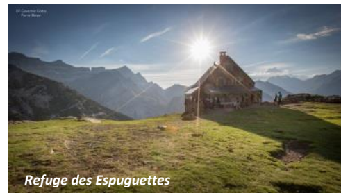
Refuge des Espuguettes

Itinéraire proposé par l'Office de Tourisme de Gavarnie-Gèdre : +33 (0)5 62 92 49 10