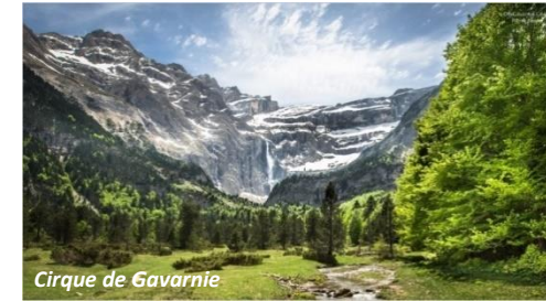
Cirque de Gavarnie

Au travers d'ambiances très variées cet itinéraire de 2 jours vous emmènera à la découverte du cirque de Gavarnie et des estives du secteur des Espuguettes, belvédère sur le Vignemale et la Brèche de Roland. L'ascension jusqu'à la Hourquette d'Alans (ou le Piméné pour les plus sportifs) vous offrira un panorama inoubliable sur le cirque d'Estaubé.