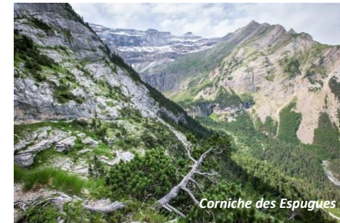
Corniche des Espuges

L'itinéraire se trouve en grande partie en zone-cœur du Parc national, les chiens y sont interdits.