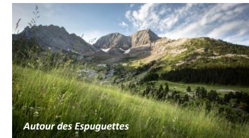
Autour des Espuguettes

Depuis le refuge, possibilité de retour à Gavarnie via la Plateau et la cabane d'Alans. Itinéraire non balisé (présence de cairns). Temps de parcours sensiblement identique.