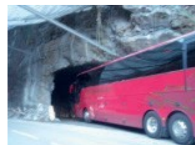
Essais de gabarit le 25/01/2017

Les unités de la gendarmerie sont chargées de gérer le passage des véhicules >3,5t et des véhicules transportant des matières dangereuses. Ils devront emprunter le tunnel un par un. Cela pourrait engendrer des ralentissements.